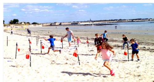
Du plaisir pour tous les publics

Cette formation peut nécessiter un accompagnant pour les personnes en situation de handicap. Tarif sur devis – Délai d'accès de 6 mois en moyenne – Document mis à jour 2022