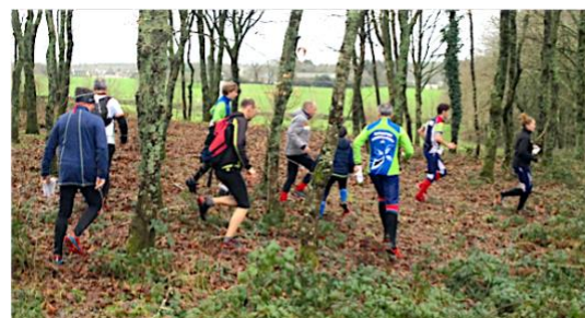
Dans les milieux naturels