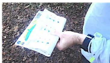
Le travail des techniques d'orientation