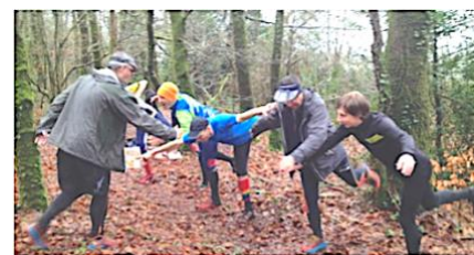
Le travail des capacités physiques

Les partages d'idées et d'outils sont particulièrement appréciés. Pensez à amener vos cartes et problématiques, pour tracer « utile ». Nous prenons le temps de découvrir les outils OCAD et SI pour l'animation. Avec un objectif de gain de temps dans vos préparations et de succès.