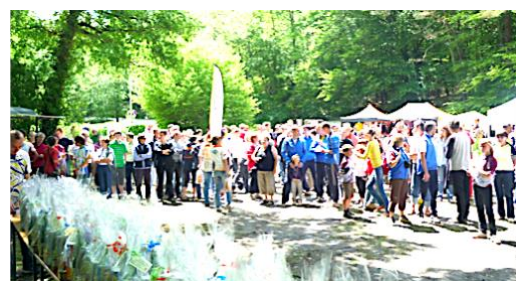
L'objectif : une compétition équitable, plaisante et intéressante pour tous.

100% de réussite depuis 2015 et 98% des stagiaires sont tout à fait satisfaits.