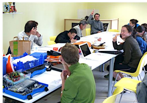
La mise en place des parcours : une organisation en équipe.