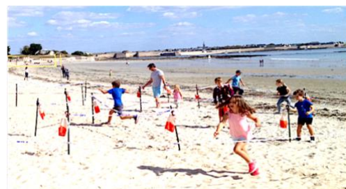
Du plaisir pour tous les publics

Cette formation peut nécessiter un accompagnant pour les personnes en situation de handicap. Tarif sur devis – Délai d'accès de 6 mois en moyenne – Document mis à jour 2022