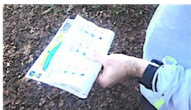
Le travail des techniques de base d'orientation