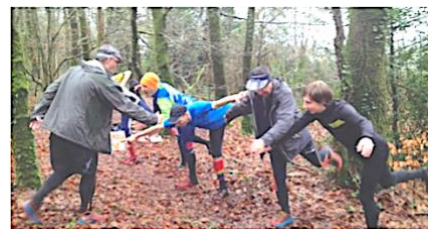
Aspects ludiques et découvertes diverses

Nous prenons le temps de découvrir les logiciels gratuits Mapper et Purple p pour finaliser les documents pour votre public.